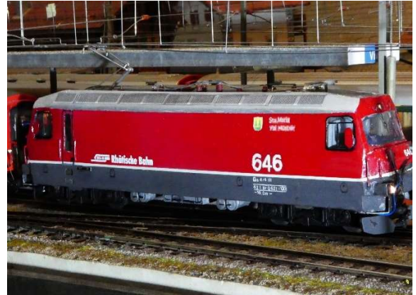
RhB Ge 4/4 III 646 von P. Schwarzenbach