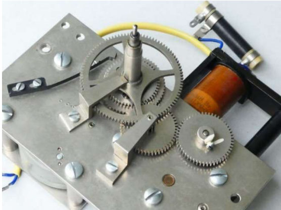
Uhrwerk der Bahnhofsuhr