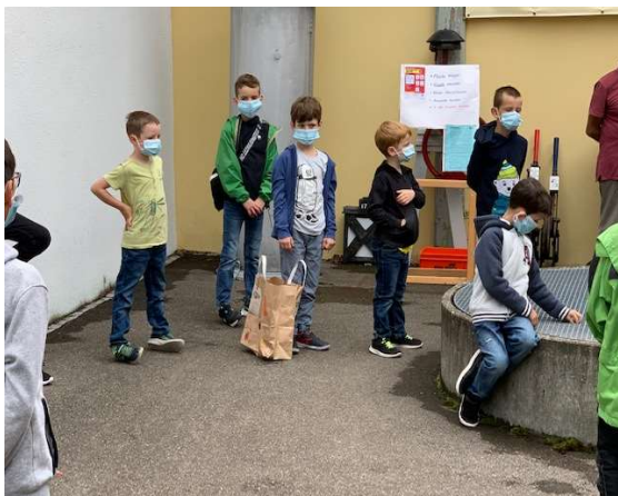
Ferienplausch mit Schutzkonzept