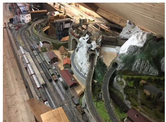
Landschaftsbau (RhB-Anlage 0m)