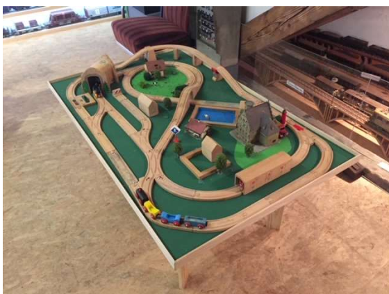
BRIO Bahn für die jüngsten Besucher