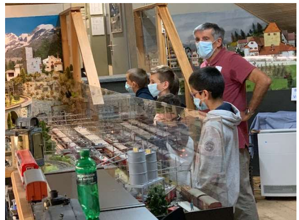
Ferienplausch Bezirk Uster